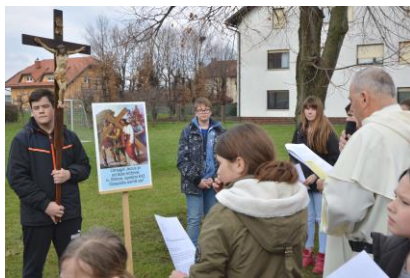
Blagoslov butar na cvetno nedeljo Križev pot zunaj bazilike na Veliki petek