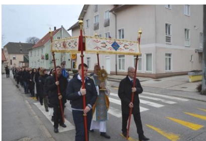
Velikonočna procesija na Velikonočno nedeljo