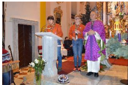
Skavti so nam prinesli betlehemske luč