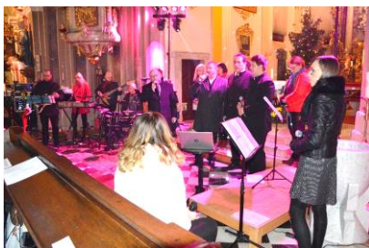
Koncert skupine »Dominič Sije« in vokalne skupine »Draž«