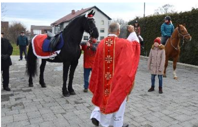
Blagoslov konj za baziliko