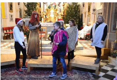
Otroška božičnica pred polnočnico na Sveti večer