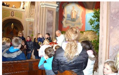
Blagoslov otrok pri jasljah