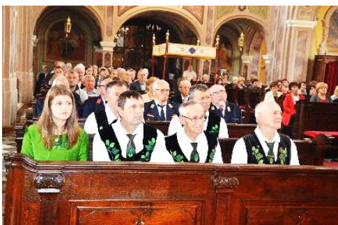
Procesija po vasi, svečana sveta maša in nogometni turnir na igrišču v Dobriši vasi.