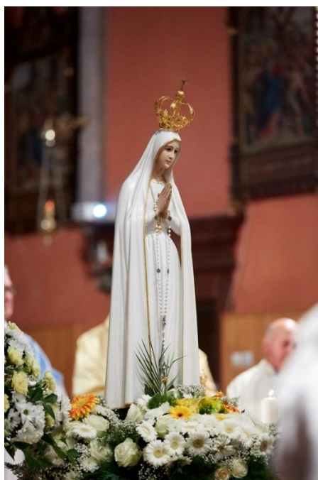
KIP FATIMSKE MATI BOŽJE

(takšen kip Marije imamo tudi na v naši cerkvi – takoj, ko vstopiš skozi glavna vrata – na desno)