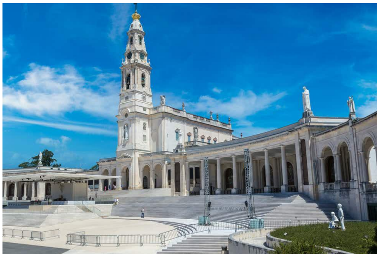
CERKEV V FATIMI NA PORTUGALSKEM (zgradili so jo na kraju, kjer se je prikazala Marija)

2. Reši še zadnjo nalogo v delovnem zvezku – na str. 66 – 67