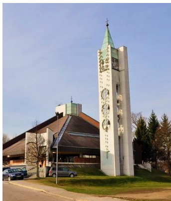
Cerkev Sv. Cirila in Sv. Metoda v Radencih

Stvarnik človeštva in njegov Rešitelj, vsake večna Ljubezen, vir dobrote naj te slavimo, kakor v tvoji slavi Ciril in Metod.